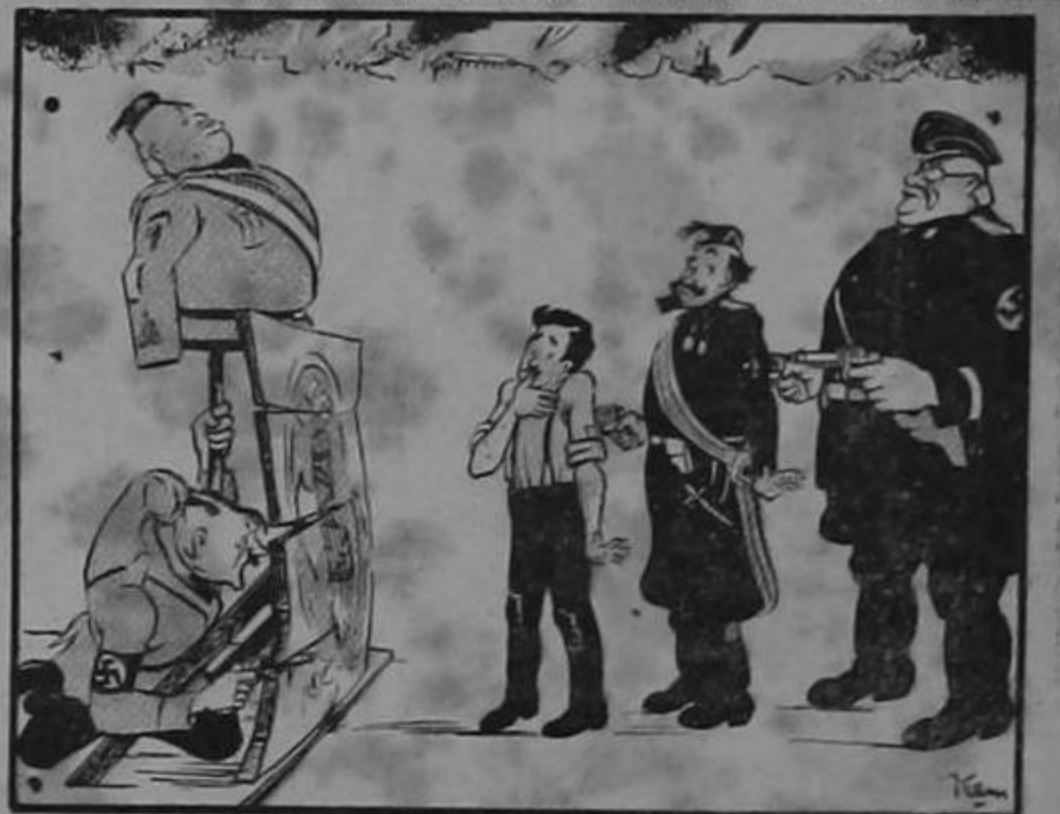
La comedia italiana

Pero en fin no hay que desesperarse; para construir las murallas chinas, apenas se gastaron cien años. No mucho.