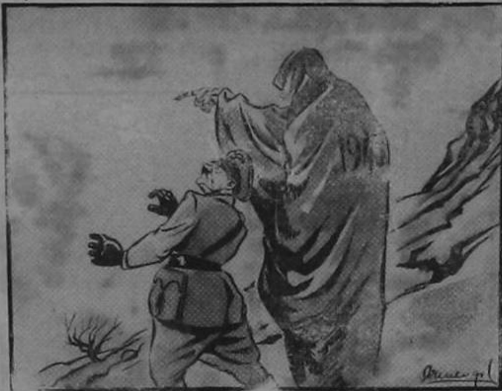
Comenzó la tormenta