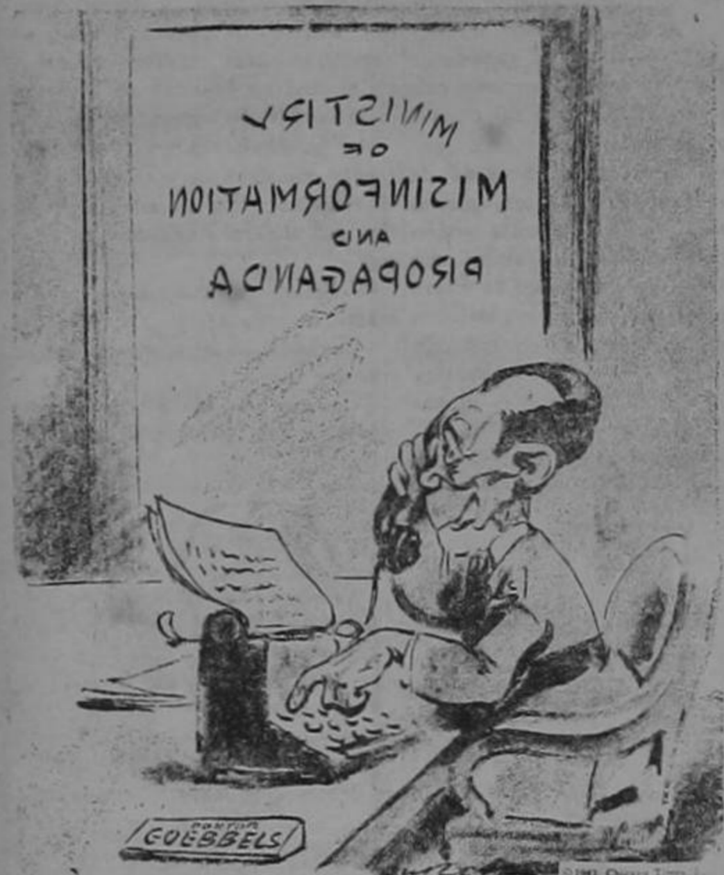
Goebbels: "No te preocupes, Adolfo, si el ejército no puede, nosotros ganaremos la guerra!"