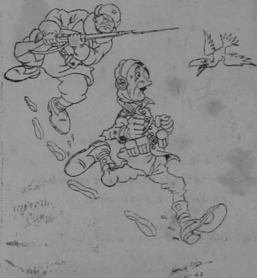
Parte alemán: Sin novedad en el frente ruso...