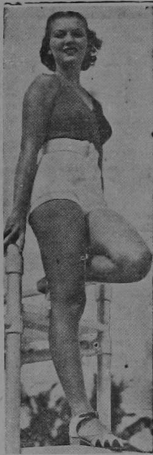
Del harem de Paco Aguiar