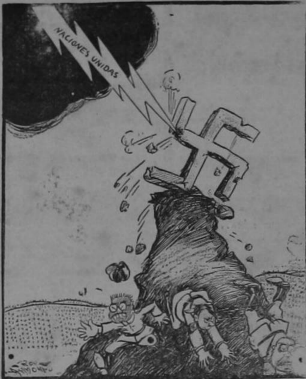
COMENZO LA TORMENTA

—¿Mil muertos? ¡Klossal! Nuestros gases son excelentes!