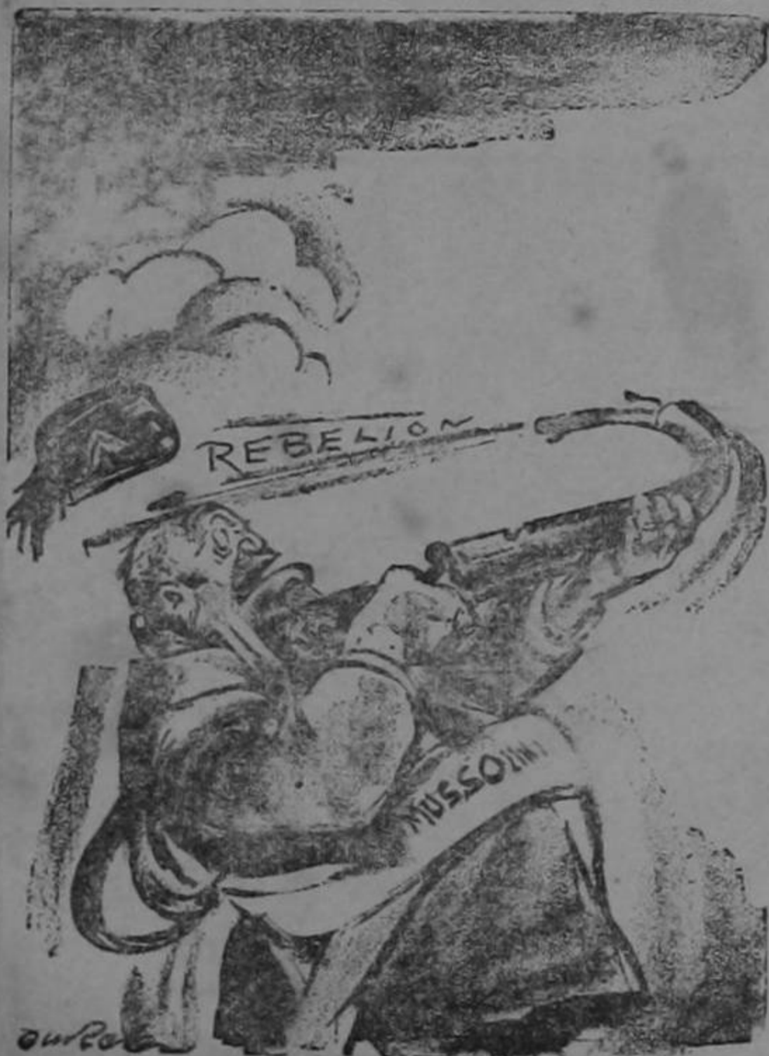
Una muestra de lo que le espera...