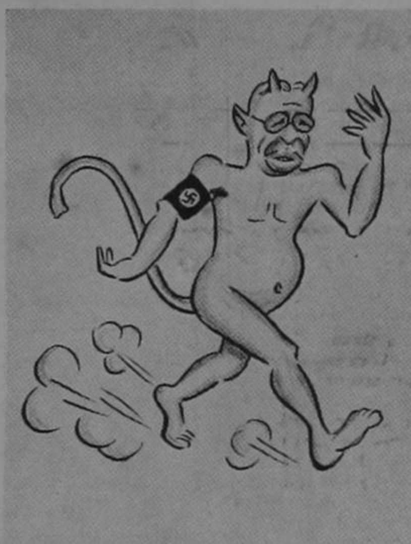
O en otras palabras: El diablo metido a predicador.