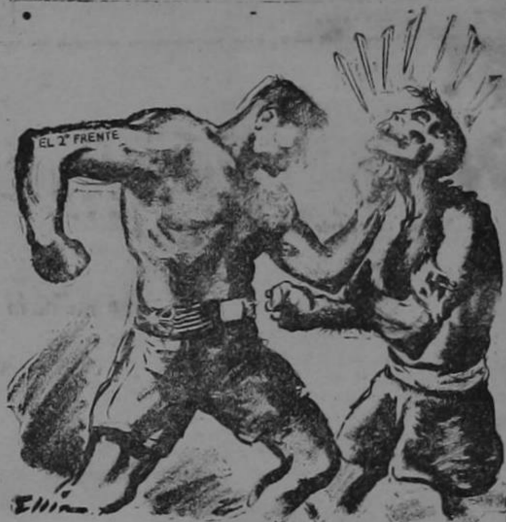
Los golpes decisivos