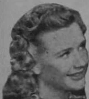
Priscilla Lane de la Warner Bros

DE VENTA EN TODAS LAS BOTICAS Y DROGUERIAS