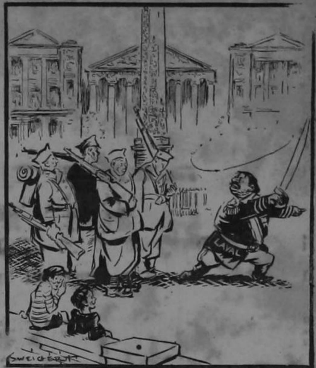
"Adelante, mis cuatro divisiones para Rusia..."

convertirnos en caníbales. Ya nosotros le estamos echando el ojo a una vecina nalga. El día menos pensado la vamos a fajar con engaños a la oficina. Y aquí sólo se oír un grito y por la ventana saldrá un aromático y apetitoso olor a bistec. No nos queda otro camino.